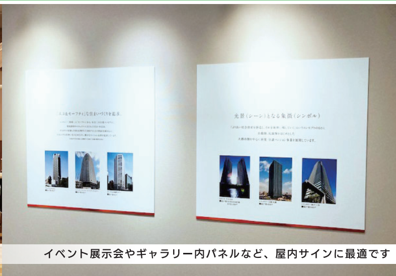
イベント展示会やギャラリー内パネルなど、屋内サインに最適です