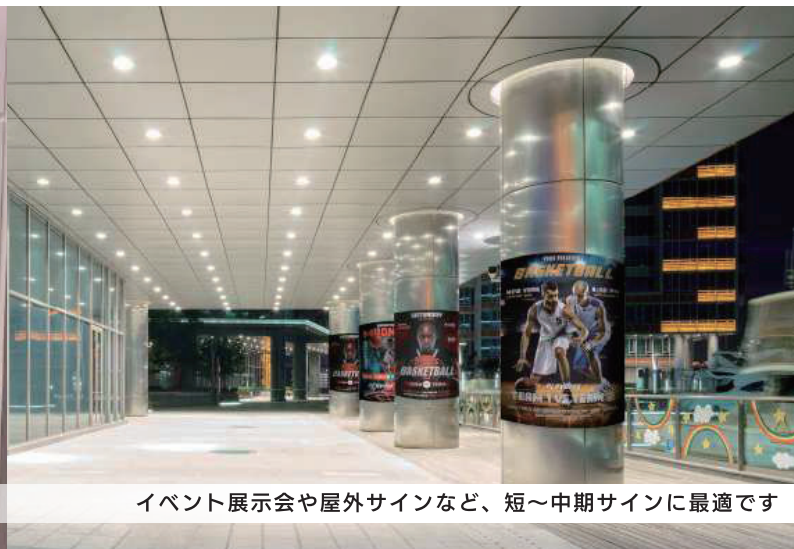
イベント展示会や屋外サインなど、短～中期サインに最適です